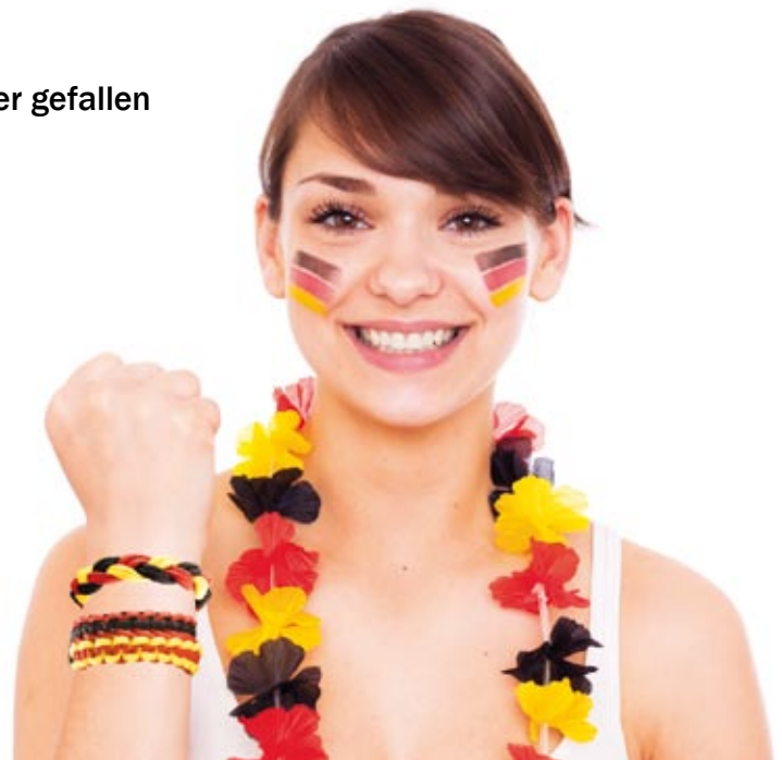
Geballte Fan-Power ...