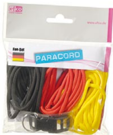
... Paracord Fan-Set!

Mit freundlichen Grüßen / Ihr EFCO-Kreativteam